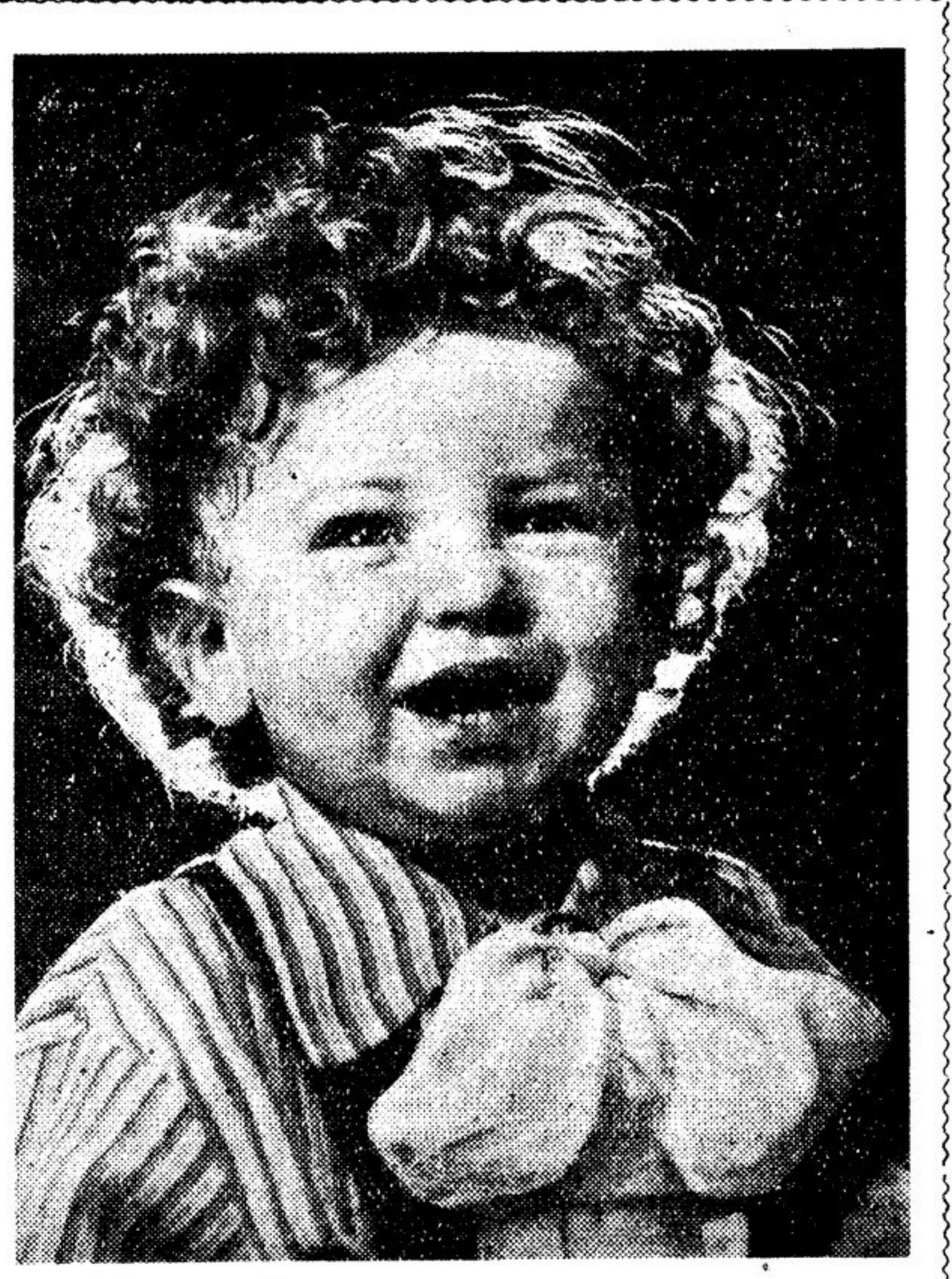
Он такой доверчивый и А в глазах неба синевы. И с высокого крыльца дачи Он глядит в простор родной страны. Мой маленький уснул совсем недавно, Не позволим, чтобы взгляд ребячий Омрачился тучами войны. стихи В. Скворцовой.

И мы не допустим, чтобы корыстные носители смерти вытоптали и испепелили, исквернили вечно, как жизнь, зеленую поросль человечества!