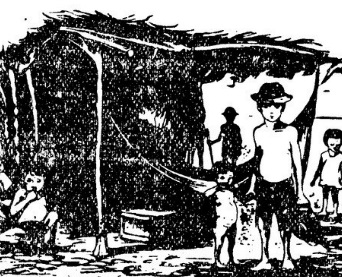
Так живут бразильские дети... Рисунок бразильской художницы Ренины Кад

страх. Почему взрослые люди должны сбросить эти бомбы, которые так всех пугают? Почему мы должны погибнуть вместе со всеми? Я не хочу даже думать об этом! Почему дурных людей, которые помышляют о войне и о том, чтобы использовать эту бомбу, не сажают сразу же в тюрьму? Ведь мама всегда говорит, что плохие люди попадают в тюрьму...». И, поняв ужас и зло надвигающегося призрака войны, маленькая девочка становится в ряды борцов за мир: «Мы в нашей секции собираем подписи за мир. Я поняла, что нужно собрать столько подписей, чтобы можно было посадить в тюрьму всех дурных людей, которые хотят применять такие страшные бомбы». Каждый год перед 1 июня — Международным днем защиты детей, знакомым с убийственной статистикой детской смертности, болезней, голодом или полного отсутствия занятий в неорганизованных зданиях школ, непосильной для малышей и подростков участью в изнурительном труде этих статистических данных для детей трудящихся в буржуазных и колониальных странах. В мире нищенствуют, голодают, бродяжничают десятки миллионов детей! А ведь «земля достаточно богата, чтобы прокормить детей всего мира», как было сказано в обращении Международной конференции в защиту детей (состоявшейся в 1952 году) к мужчинам и женщинам всех стран.