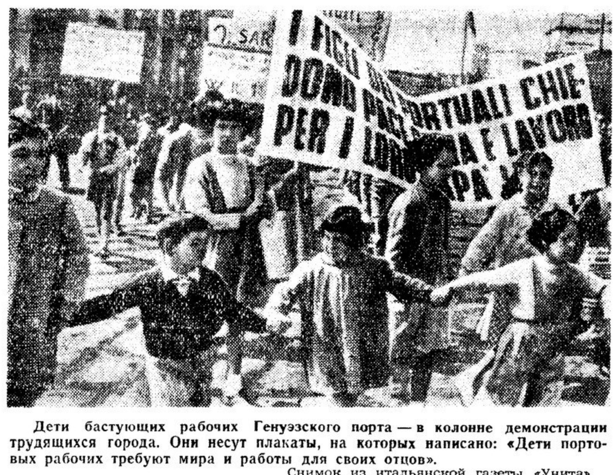
Дети бастующих рабочих Генуэзского порта — в колонне демонстрации трудящихся города. Они несут плакаты, на которых написано: «Дети портовых рабочих требуют мира и работы для своих отцов».